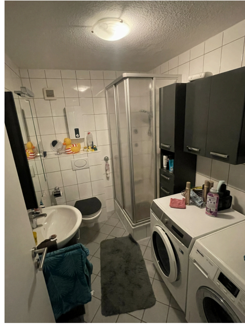
20260305 Bad 1