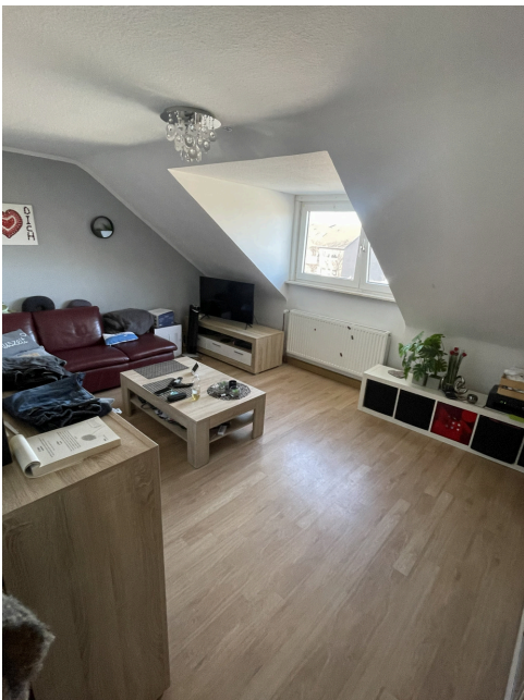
20260305 Wohnzimmer 1