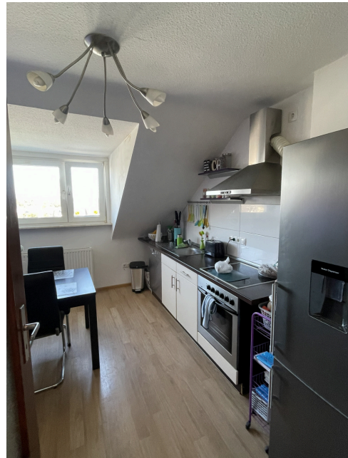
20260305 Küche 1