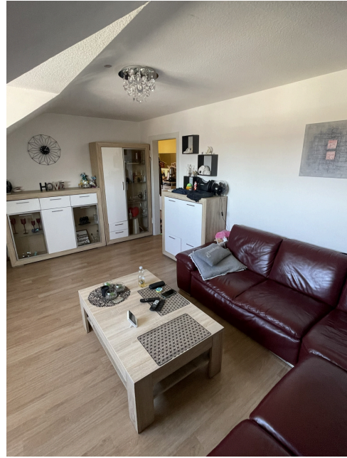
20260305 Wohnzimmer 2