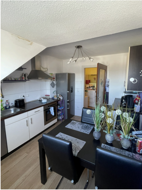
20260305 Küche 2