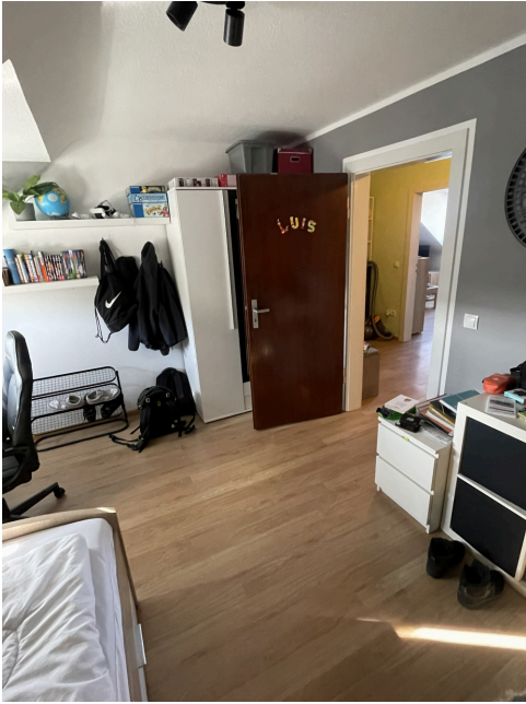
20260305 Schlafzimmer 2