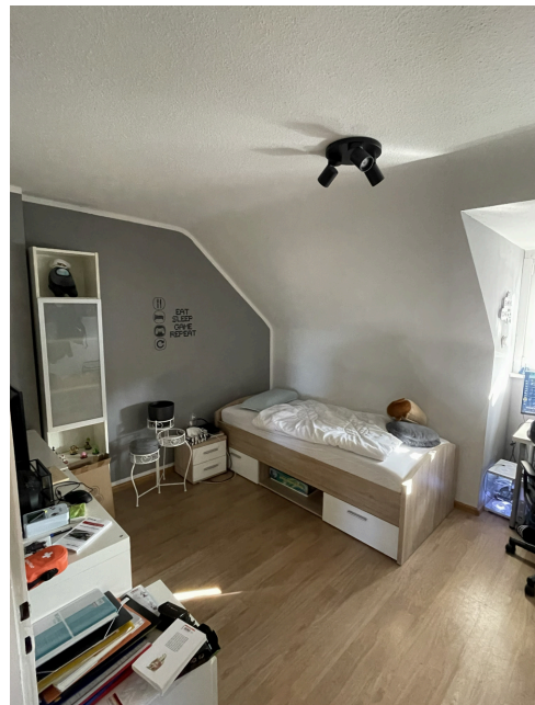
20260305 Schlafzimmer 1